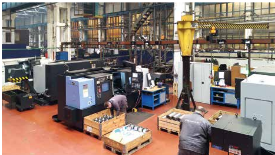
■ Pohled do výrobní haly na nové stroje investované v roce 2018

dosáhl. Neodmyslitelně ke mně patří i velká záliba ve fotografování. Zaměřuji se především na volně žijící zvěř, ptáky a hmyz. Mou výhodou je to, že Bardejov a slovensko-polské pohraničí poskytují mnoho možností pro dobré fotografie z přírody. Je však třeba konstatovat, že času je na to velmi málo, při všech pracovních povinnostech.