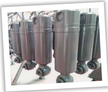
■ Hydraulické válce - schnoucí barva na lakovně pro odběratele Liebherr

V soukromém životě mohu vzpomenout to, že se nejvíc těším ze zdraví své rodiny, které do jisté míry vděčím za to, čeho jsem v životě