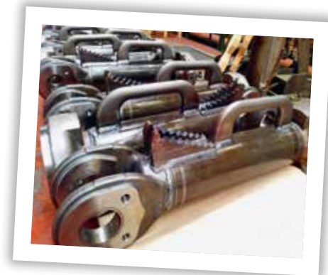
■ Specificky prodloužená svářená zadní víka pro odběratele Caterpillar USA