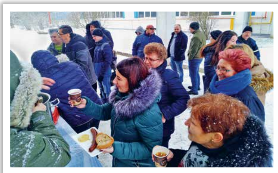
■ Nová tradice - vánoční punč s chutnou klobásou pro zaměstnance 20. 12. 2018

Pracuji v naší firmě od r. 2001. Myslím, že je to dostatečně dlouhá doba na to, abych mohl posoudit náš vývoj z dlouhodobějšího hlediska. Rok 2018 vnímám proto jako velký milník v historii této strojírenské společnosti. Poté, co došlo v říjnu 2017 k začlenění SBAJ INMART, a.s. do skupiny CHARVÁT Group, nasledovalo v červenci 2018 její přejmenování na CHARVÁT Strojárne, a.s. Začali jsme při dodavatelsko-odběratelských jednání vystupovat pod značkou CHARVÁT. A snažili jsme se přitom jako nejmladší přírůstek do rodiny přinést také něco pozitivního značce CHARVÁT na trhu.